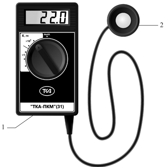
Рис.1 – Внешний вид прибора “TKA-ПКМ”(31) 1 – блок обработки сигналов; 2 – фотометрическая головка.